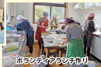
ボランティアランチ作り