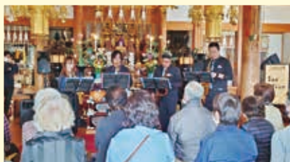
お寺の中での演奏